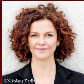
Angelika KIRSCHSCHLAGER