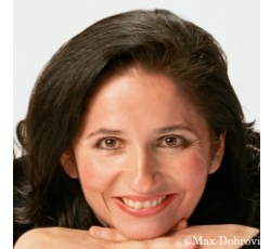
K. アダム ヴァイオリン