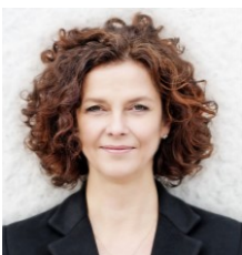
A. キルヒシュラーガー 声楽