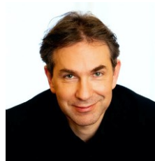
C. ヒンターフーバー ピアノ