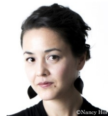
C. ヘルマン ピアノ