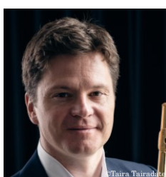
K-H. シュッツ フルート