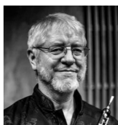
T. インデアミューレ オーボエ