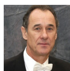
J. ヒンドラー クラリネット